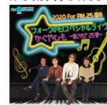
出演 かぐやひも dream bamboo